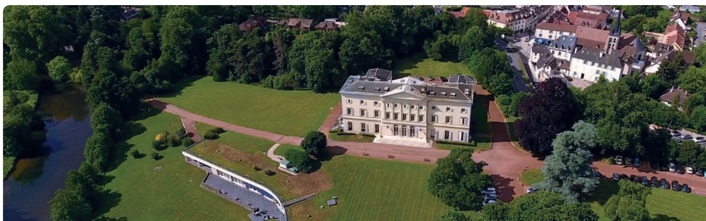
Vue aérienne d'HEC Paris Le Château

Les bois du parc, communs désormais à l'ensemble HEC Paris, qui avaient été gravement touchés lors de la grande tempête de 1999, sont entretenus par l'ONF (Office National des Forêts) et son fleuron, un immense séquoia, est toujours là.